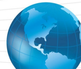
Figura de cumplimiento en Costa Rica